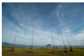
飛天掃帚裝置藝術

J 海科館 「潮境」指的是寒、暖兩潮流的混合區，經海洋科技博物館籌備處規劃改建後，成為一處看海賞景的最佳去處，公園裡的生態豐富，風